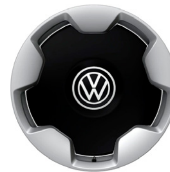
03 - Stockton