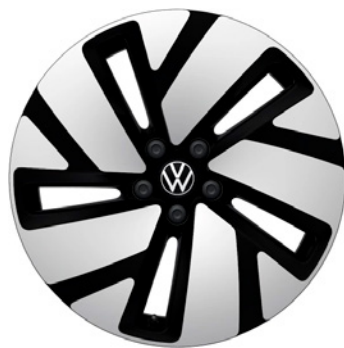
01 - Tilburg