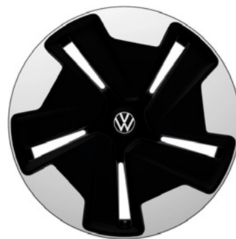
05 - Bromberg