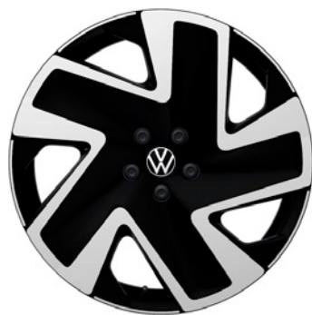
04 - Solna