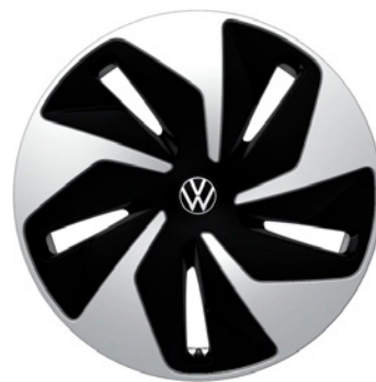
02 - Venlo